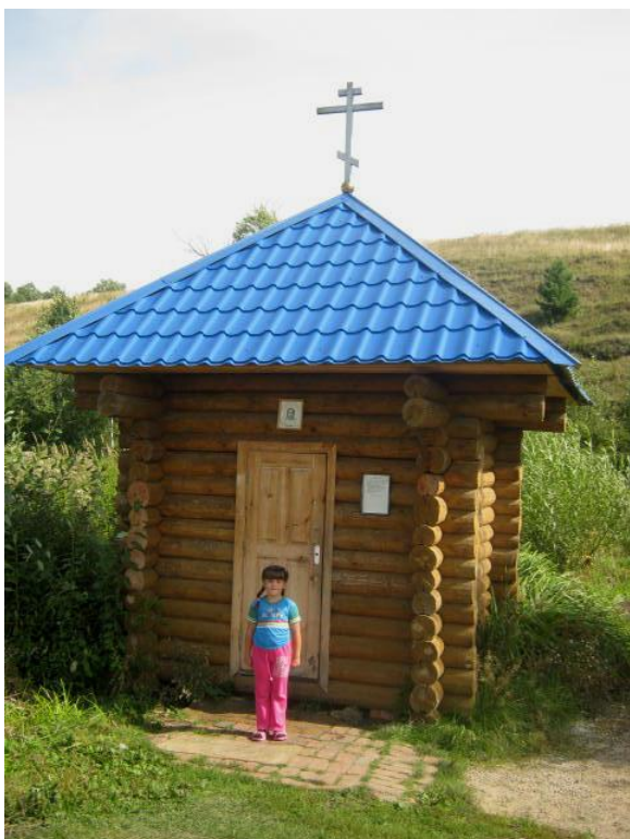
/Купальня Праскевы Пятницы/