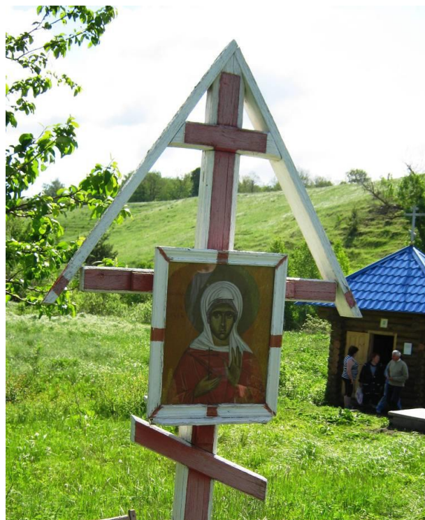
/Православный крест Праскевы Пятницы/