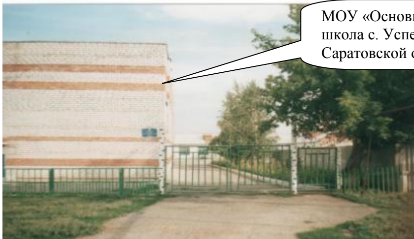
МОУ «Основная общеобразовательная школа с. Успенка Пугачевского района Саратовской области»

Очень долгие годы дети обучались грамоте в церковно-приходской школе. Этой грамоты в то неторопливое время вполне хватало. Знания давались по тем временам разносторонние и прочные. Люди, закончившие ее, пользовались большим авторитетом.