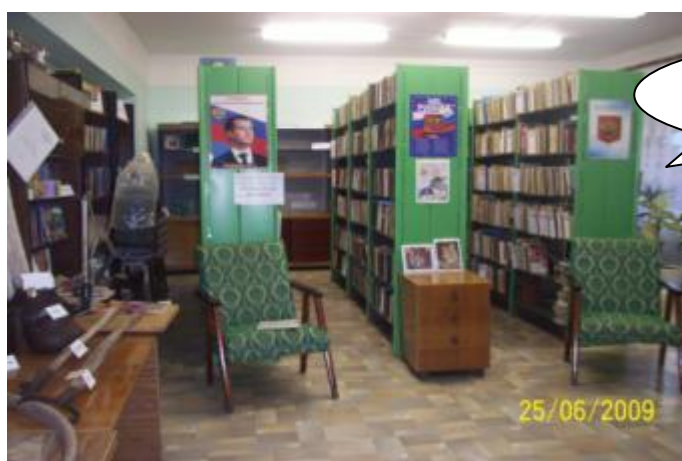
Успенская сельская библиотека

С апреля 2006 года библиотека находится в прекрасном здании администрации Преображенского муниципального образования и является островком культуры, информации и просто местом отдыха односельчан. В ней всегда тепло, светло и уютно. Жители разного возраста от дошкольников до пенсионеров приходят сюда за книгой.