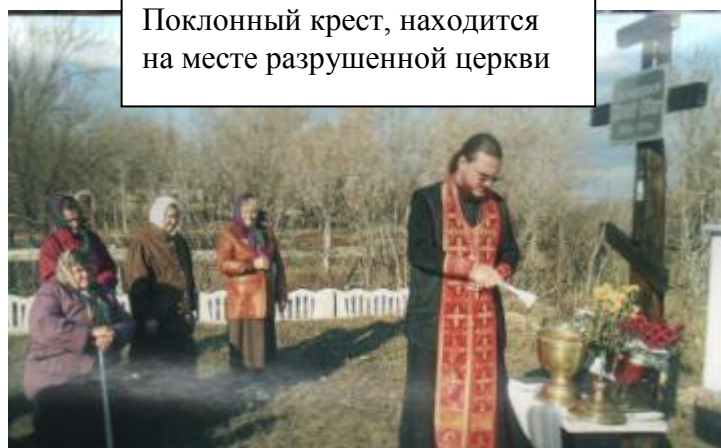
Поклонный крест, находится на месте разрушенной церкви

На территории муниципального образования имеется отделение сбербанка, почта, АТС, 4 магазина, где трудятся замечательные люди села.