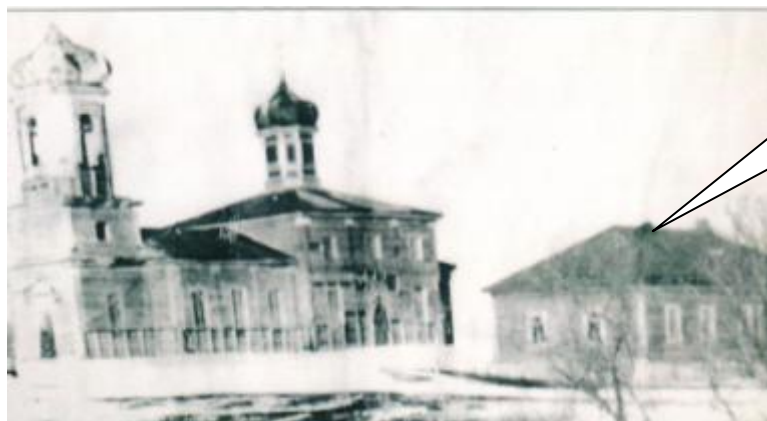
Одноклассная церковно-приходская школа

1897-1934 г.г. – одноклассная церковная школа, обучали детей один священник и один учитель. В 1910 году учились 49 детей (8 девочек и 41 мальчик).