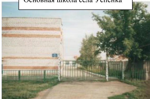
Основная школа села Успенка