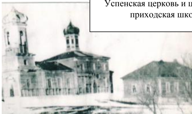
Успенская церковь и церковно-приходская школа

Весной 1862 года переселенцы прибыли на место. Первое время они жили в землянках, но постепенно они стали обзаводиться домами. Новое поселение сразу же получило неофициальное название Чугуны, т. к. жители его незадолго до этого выплавляли чугун. Официально же было принято другое название – Новички, поскольку это было самое молодое поселение среди остальных. В 1884 году в селе заложили церковь в день религиозного праздника Успения. Отсюда и было присвоено селу его теперешнее название Успенка.