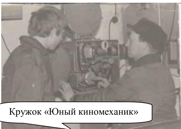
Кружок «Юный киномеханик»

В здании клуба располагалась киноустановка, демонстрировались различные широкоформатные фильмы. Детский билет стоил 5 копеек, а взрослый – 20 копеек.