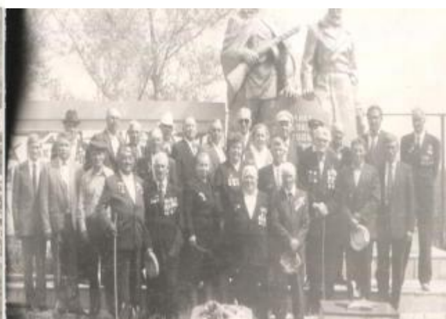
Памятник воинам, павшим в годы гражданской и Великой Отечественной войн